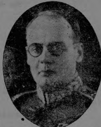
GENERAL LAZARO CHACON

Vino la reacción que culminó con el cuartelazo del 5 de diciembre de 1921 y los viejos servidores de Estrada Cabrera ocuparon el Poder. Lógico es imaginar que las viejas prácticas se pusieron a la orden del día; pero algún cambio tenía que operarse y en efecto, se operó. El primer paso de los vencedores fue el odioso de repartirse los 44.000 kilómetros cuadrados de El Petén en tres zonas chicleras que luego negociaron: el general Orellana, el general Lima y el general Ubico se pagaron con esas grangerías, su participación en el golpe de cuartel. Dos reacciones conservadoras se ahogaron en sangre y a la caída del general Ubico del Ministerio de la Guerra, una era de tranquilidad y trabajo se operó en el gobierno. El general Orellana, escuchó el clamor popular y llevó a su ministerio al licenciado Carlos Zachrisson, poniendo en sus manos la cartera de Hacienda. La bonanza mundial principiaba y el café, regulador de la economía nacional, subía de precio fabulosamente.